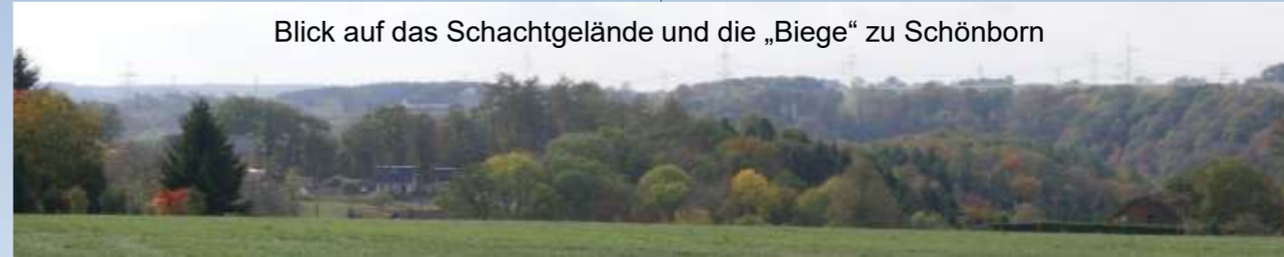
Blick auf das Schachtgelände und die „Biege“ zu Schönborn